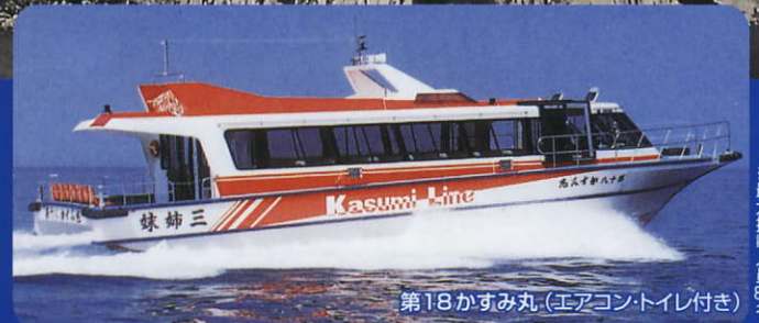
第18かすみ丸 (エアコントイレ付き)