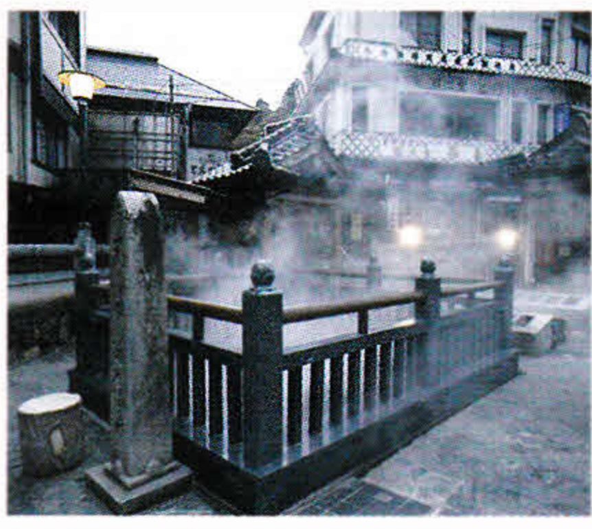
湯村温泉 (車で約40分) 「夢千代日記」の舞台としても有名な湯村温泉では、98度の高温の湯が湧き出しています。