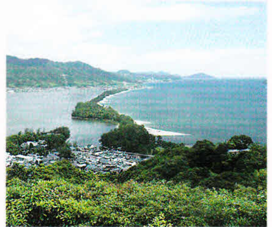
天の橋立 (車で約110分) 日本三景の一つで、宮津湾と阿蘇海に横たわる約3.6kmの長大な砂嘴が神秘的です。