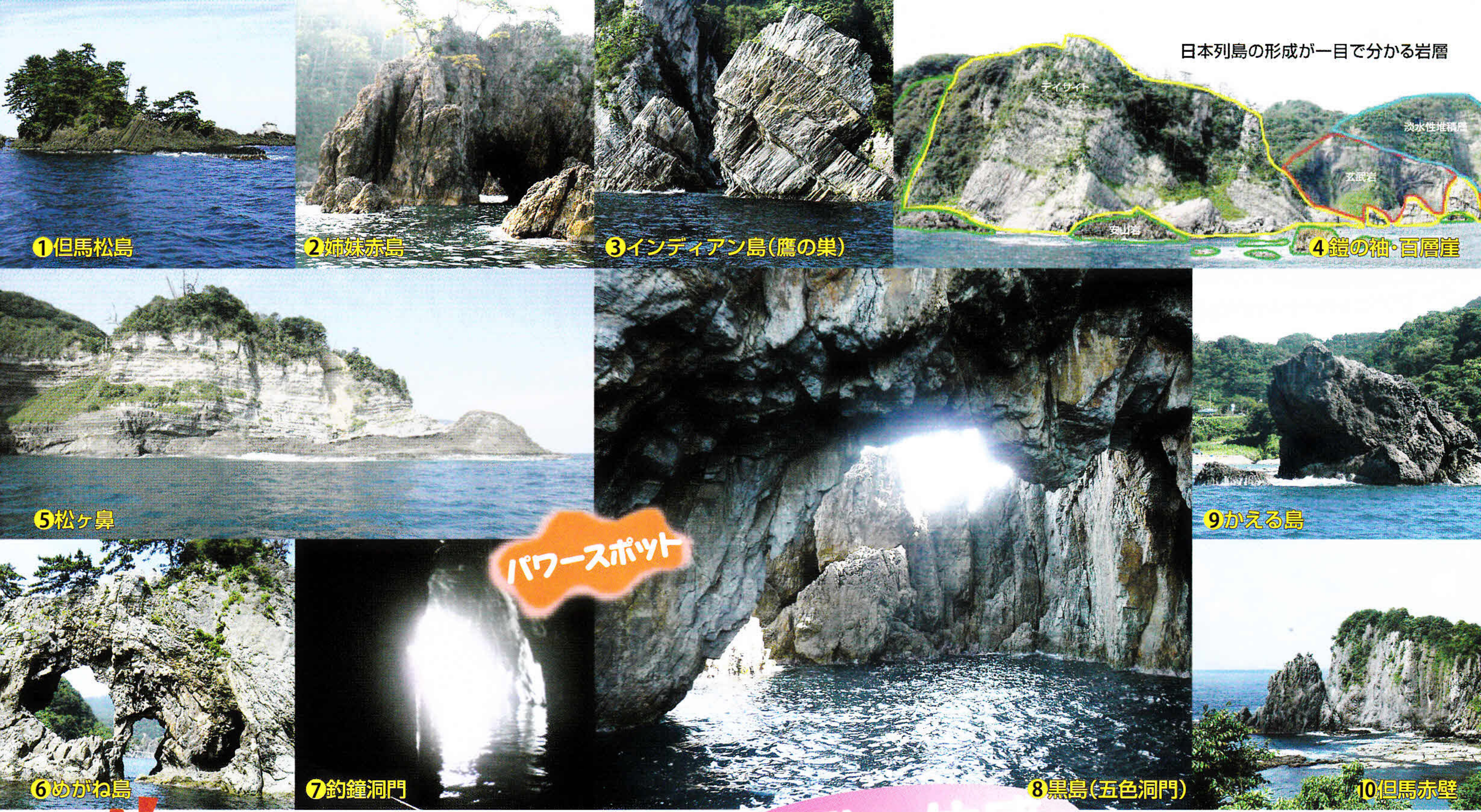
日本列島の形成が一目で分かる岩層