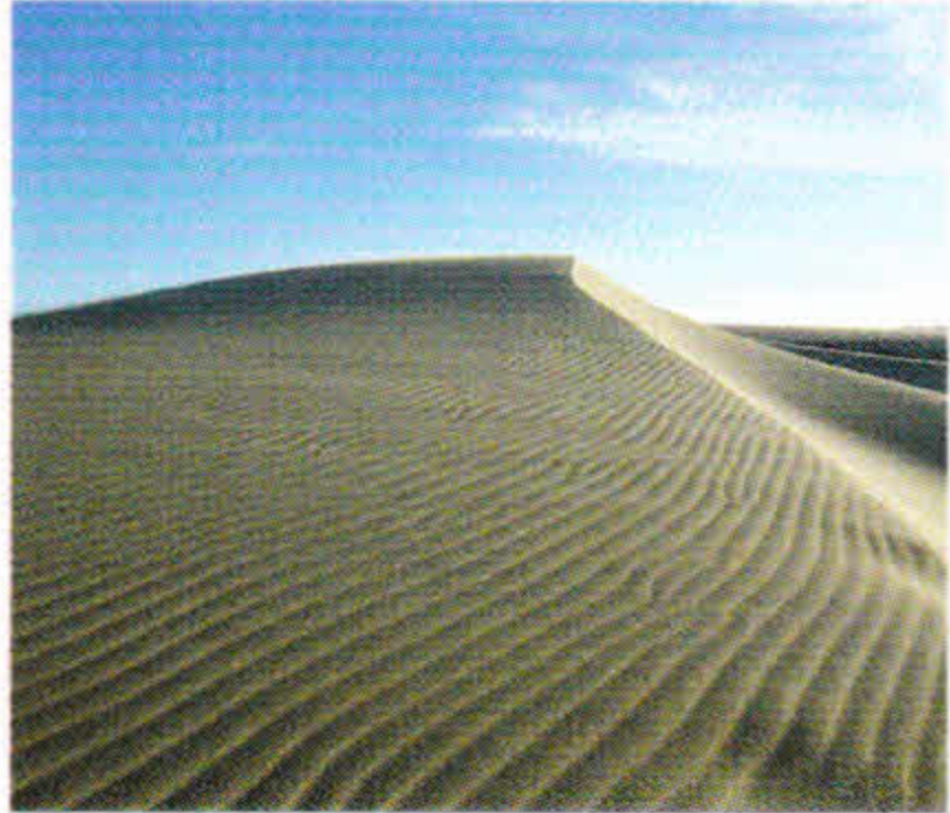
鳥取砂丘 (車で約55分) 日本海海岸に広がる南北2.4km、東西16kmに広がる日本最大の観光砂丘です。