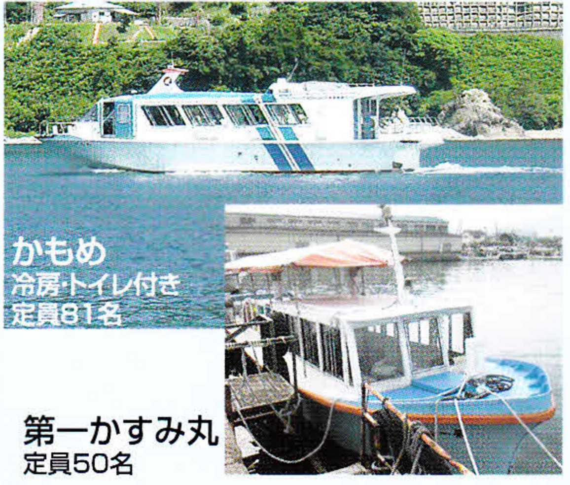
第一かすみ丸 定員50名