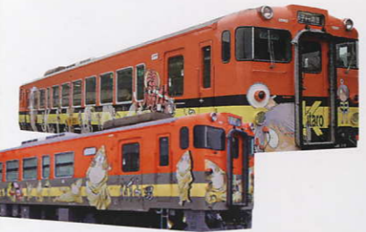
JR境線(境港→米子)を走る鬼太郎列車とねずみ男列車