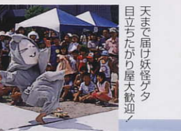
妖怪そのくりコンテスト 天まで届け妖怪ゲタ 目立ちたがり屋大歓迎