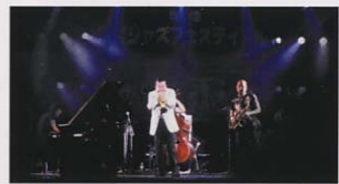
豪華ミュージシャンの出場で盛り上がる境港妖怪ジャズフェスティバル