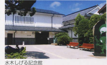
水木しげる記念館