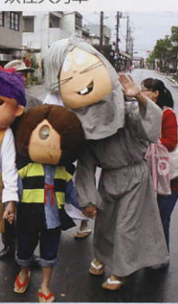
妖怪人力車 水木しげるロード ©水木プロ

駅前通りを真っすぐ行く妖怪たちが次々出現。かわいらしい妖怪たちがブロンズ像となつて皆さんをお迎えします。