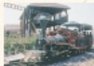
こどもの国 (車で3分)